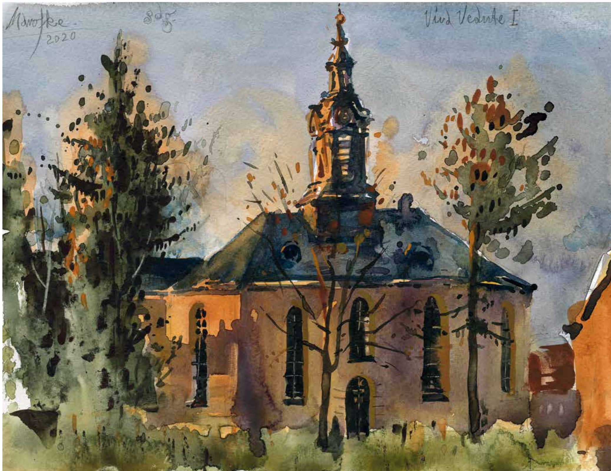
Die Kreuzkirche in Zeulenroda – Viva Vedute I · 2020 · Aquarell · 240 x 320 mm