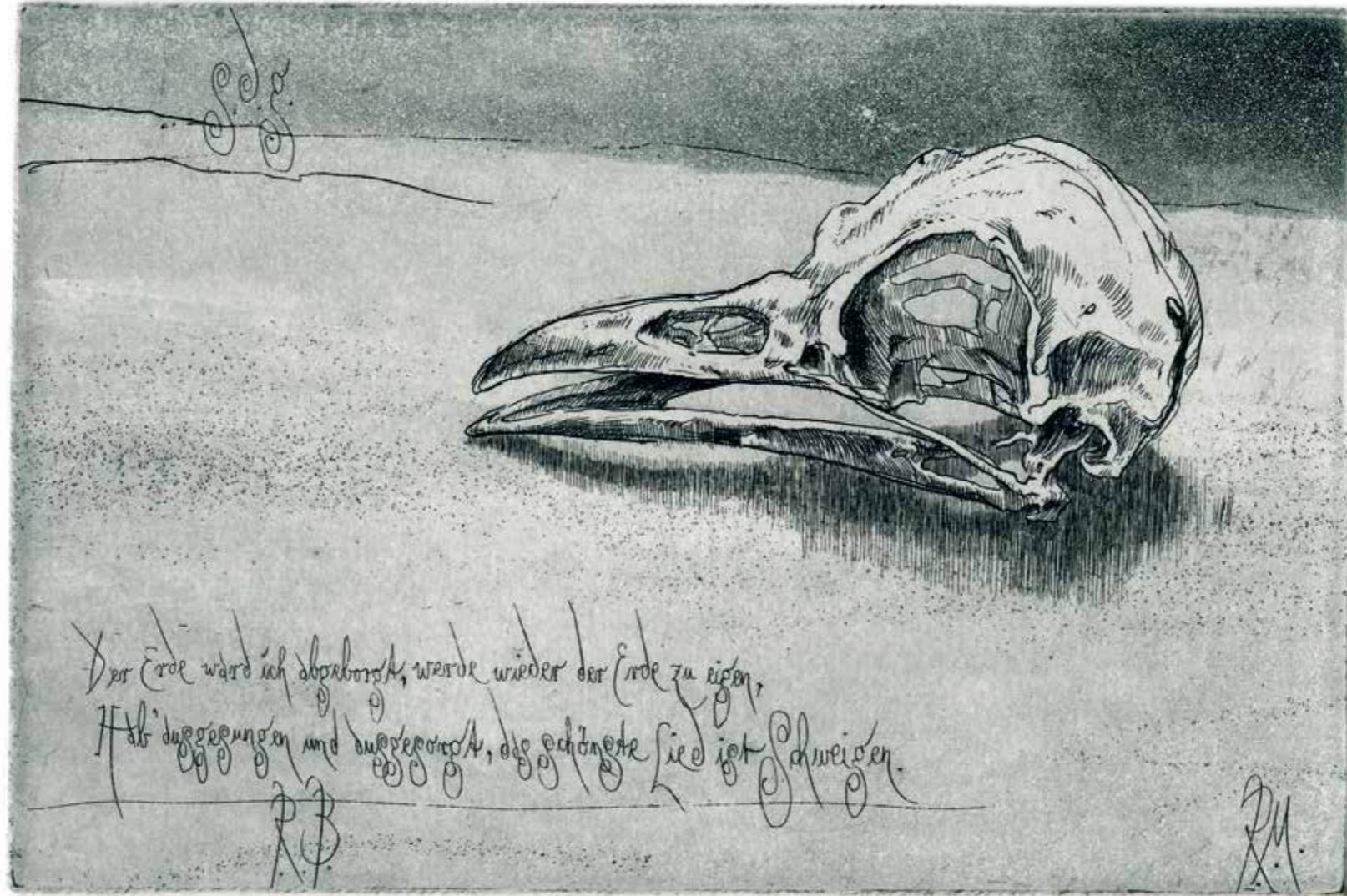
Stummes Lied (für Rudolf Baumbach) · 2012 · Radierung/Aquatinta · 98 x 145 mm