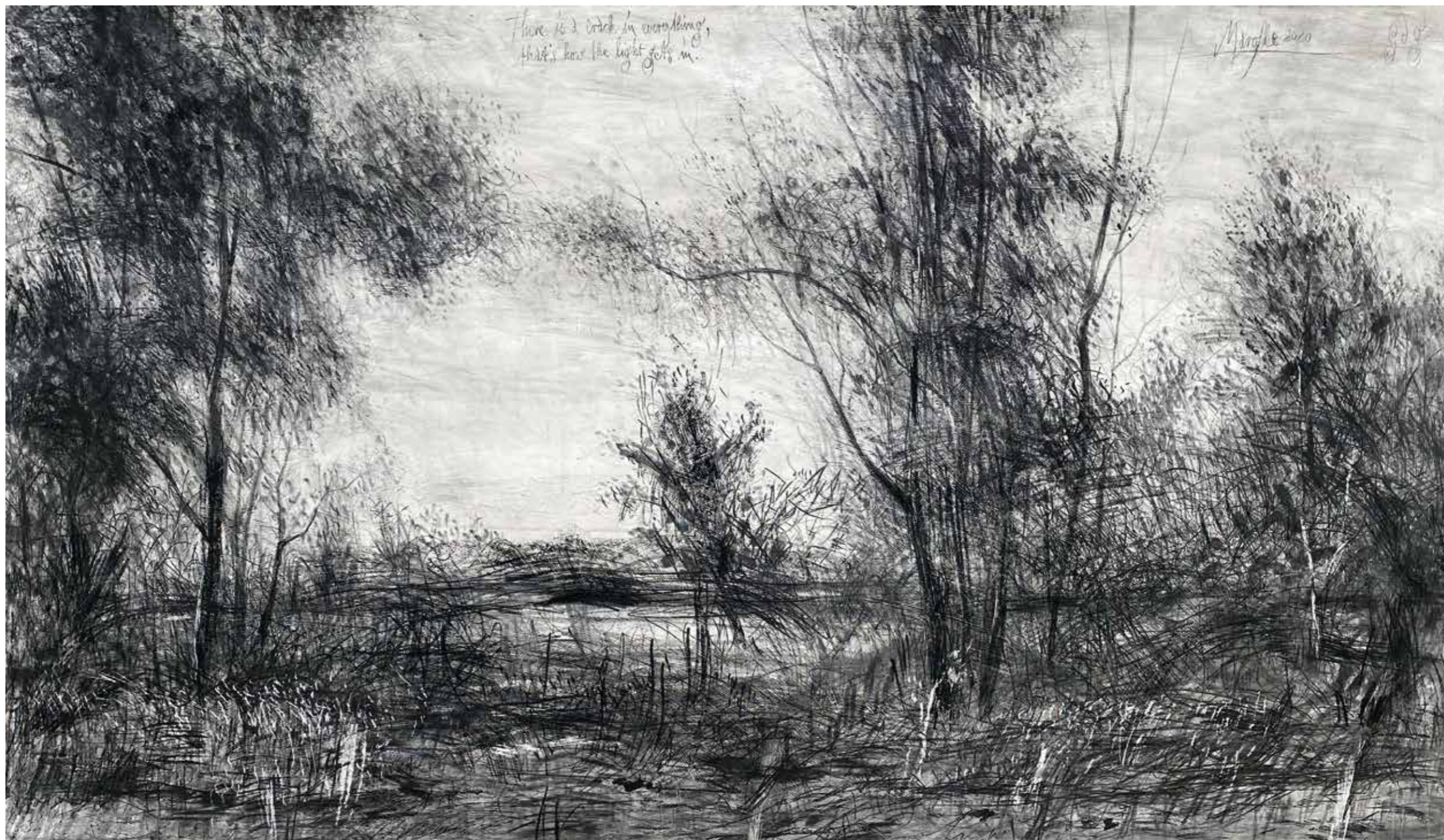
Am Seeufer · 2020 · Grafit auf grundiertem Karton · 980 x 1690 mm