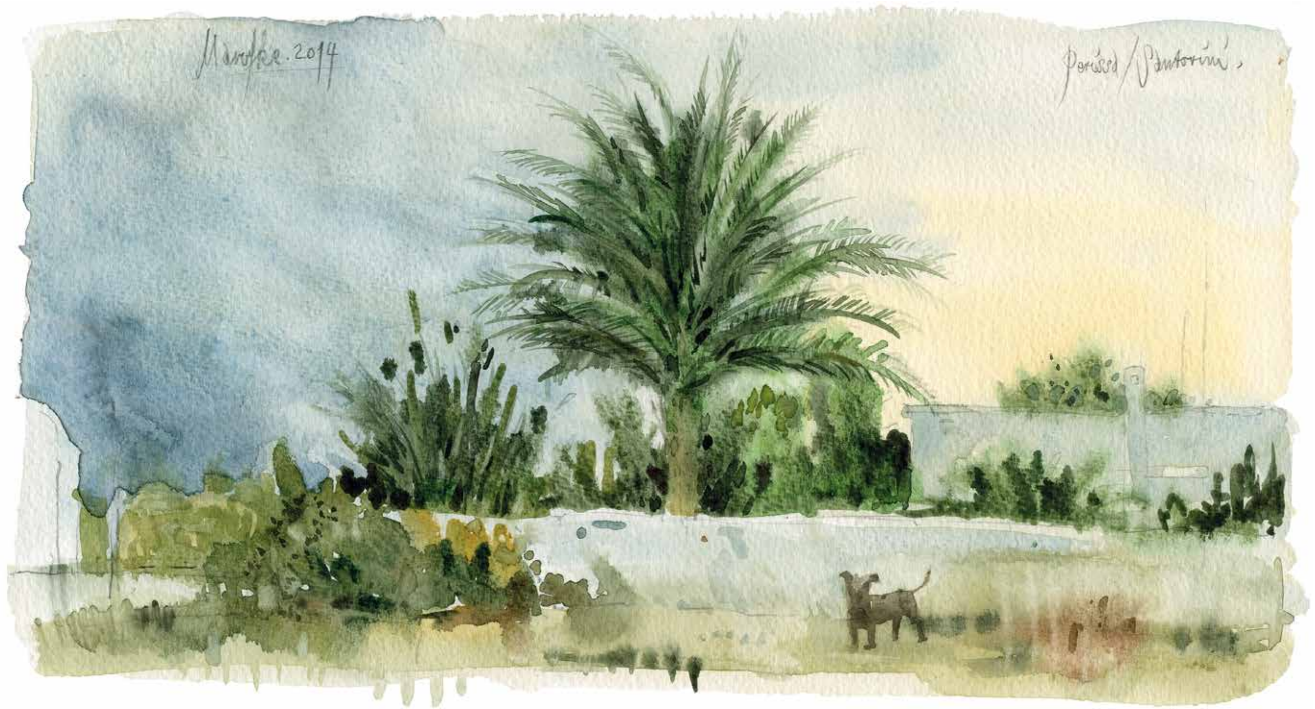
In Perissa auf Santorin · 2014 · Aquarell · 170 x 315 mm