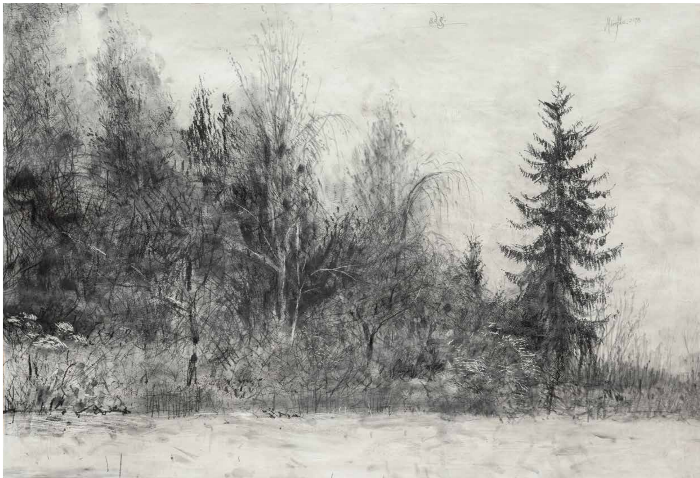
Waldrand (Der Wächter) · 2018 · Grafit auf grundiertem Karton · 685 x 990 mm