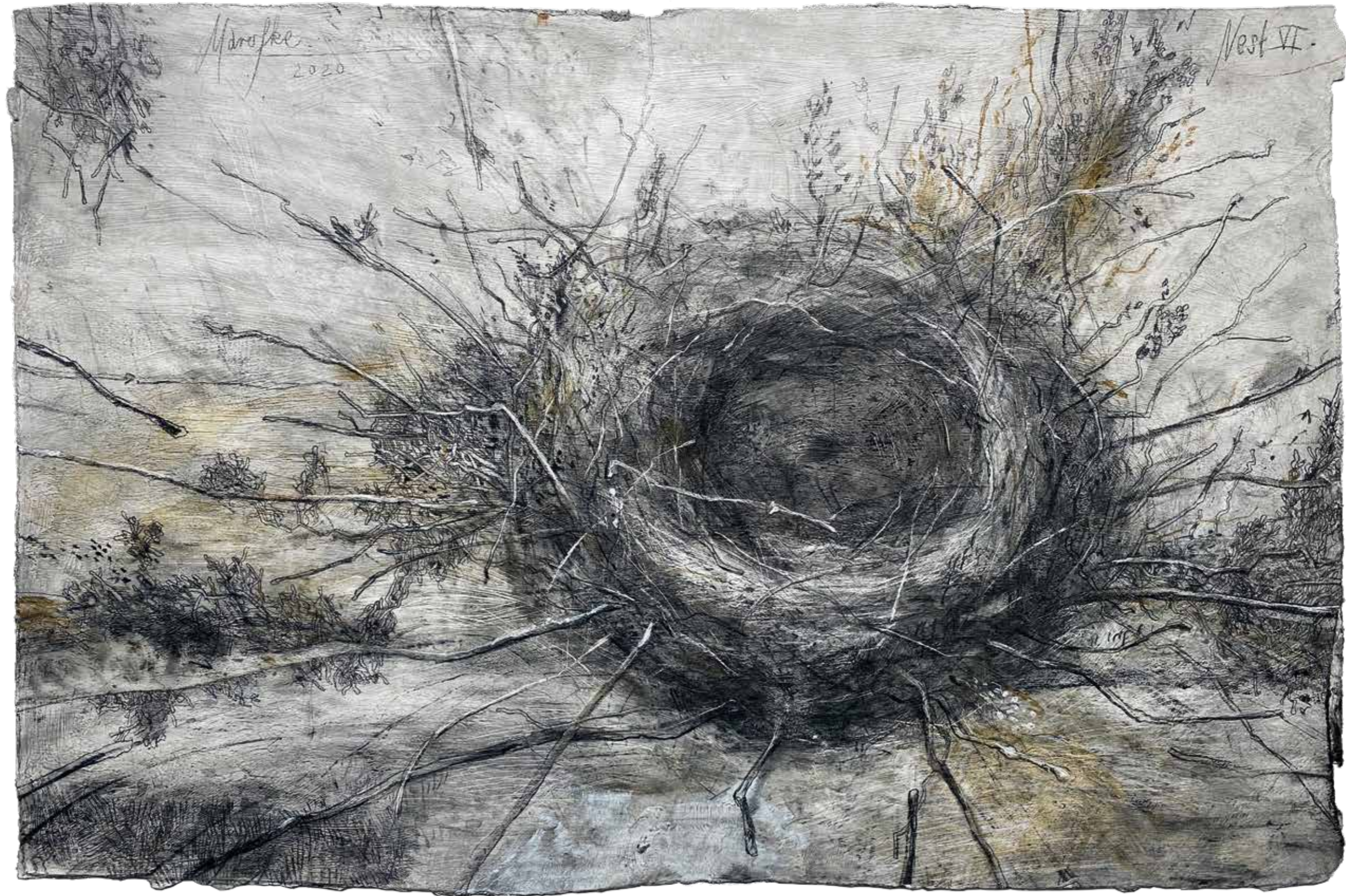
Nest VI · 2020 · Grafit und Farbstift auf grundiertem Karton · 305 x 465 mm