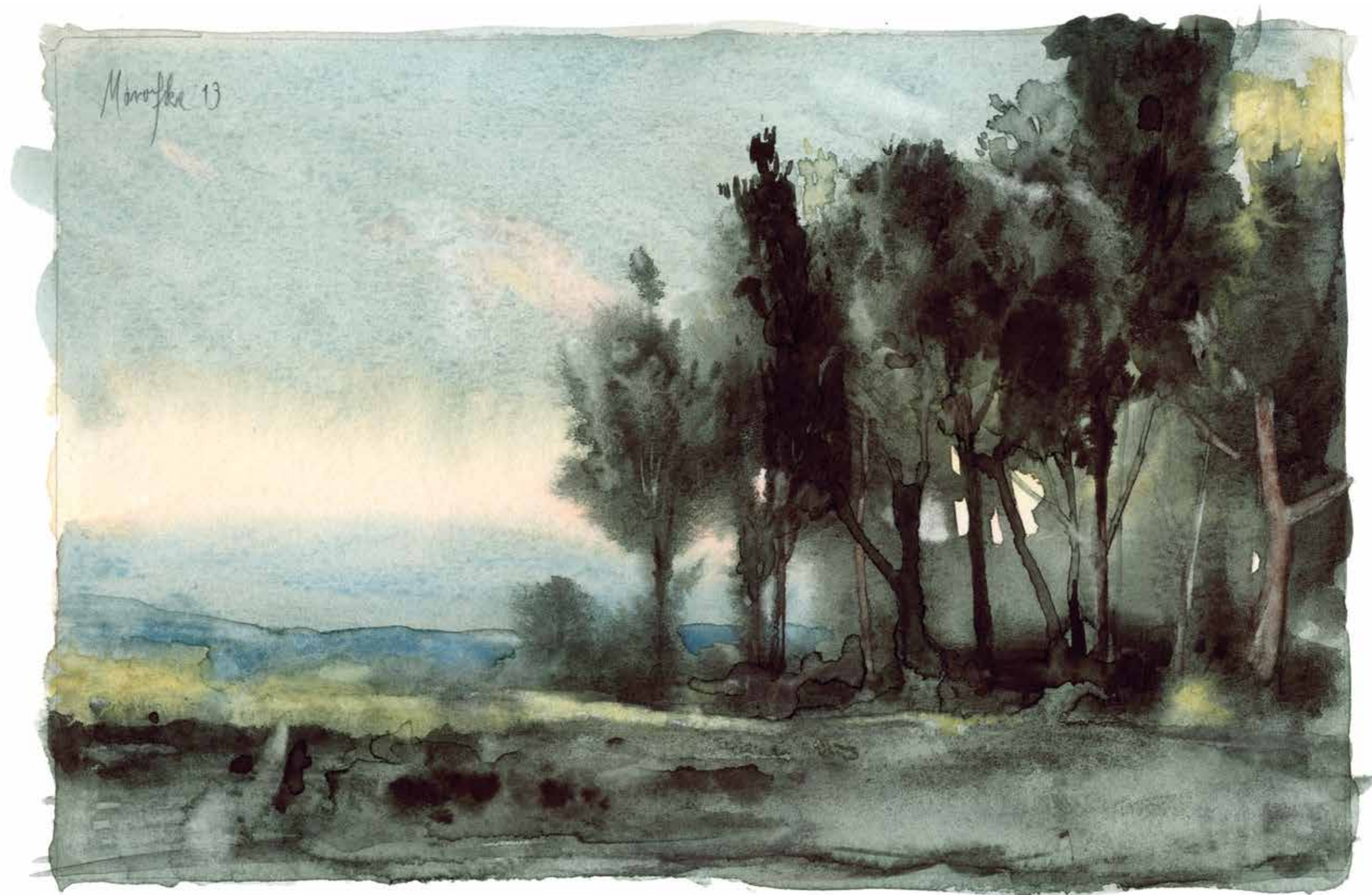
Irgendwo · 2013 · Aquarell · 140 x 210 mm