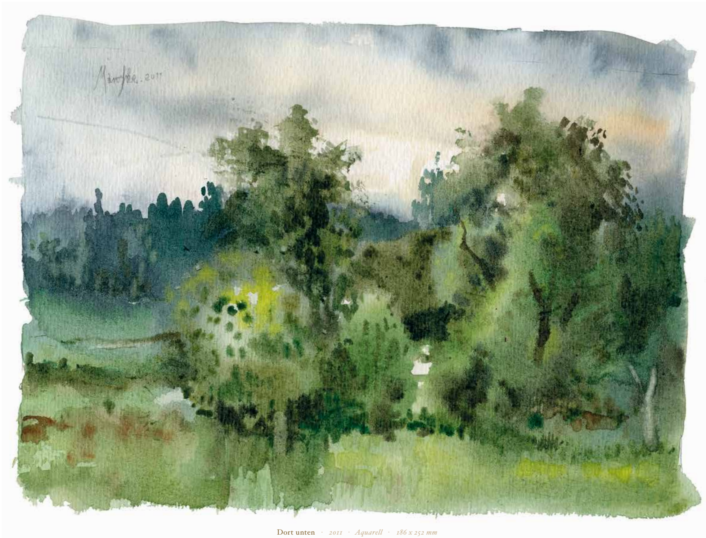
Dort unten · 2011 · Aquarell · 186 x 252 mm