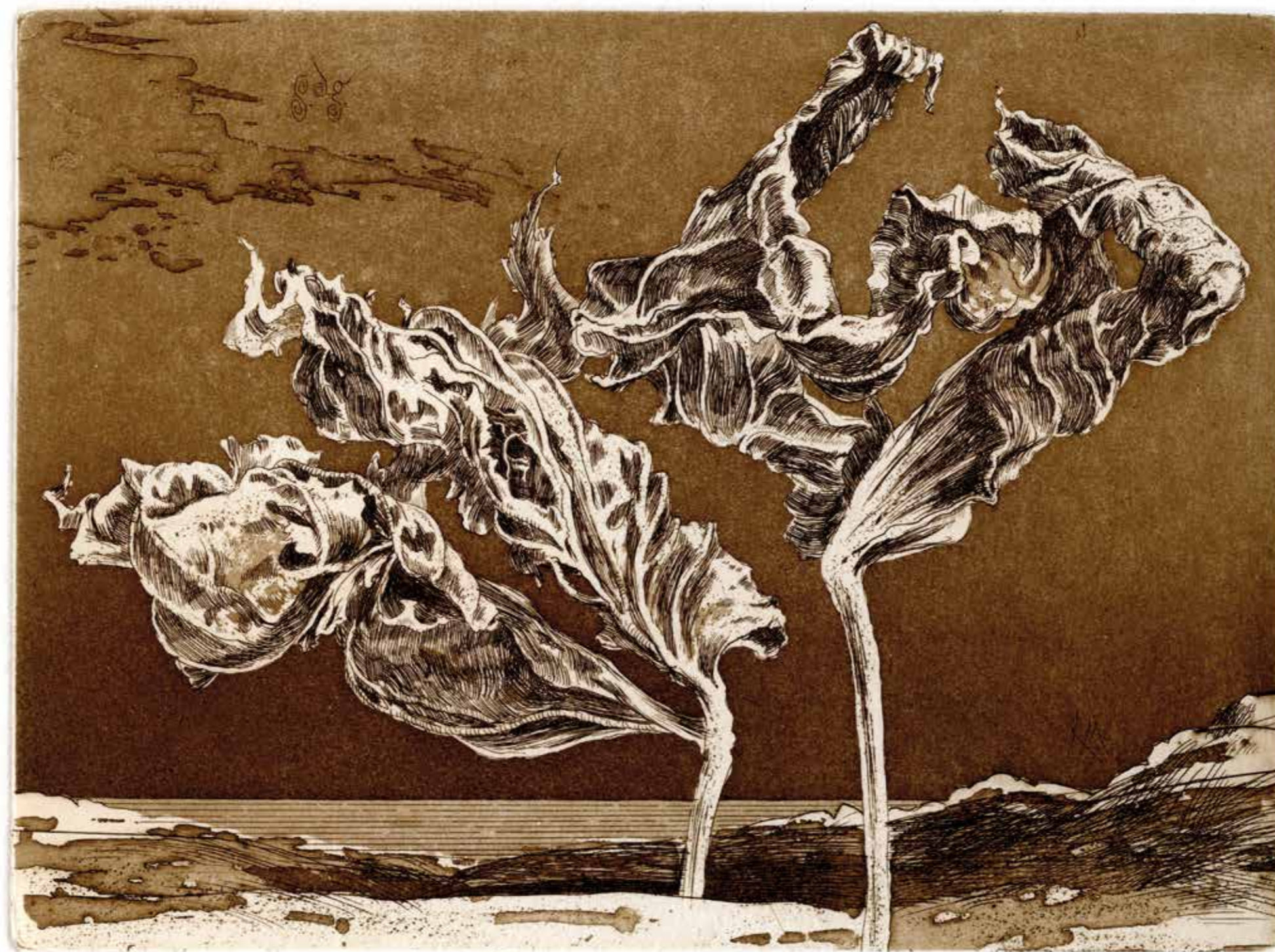
Narrenspiele im Wind · 2010 · Radierung/Aquatinta · 145 x 195 mm