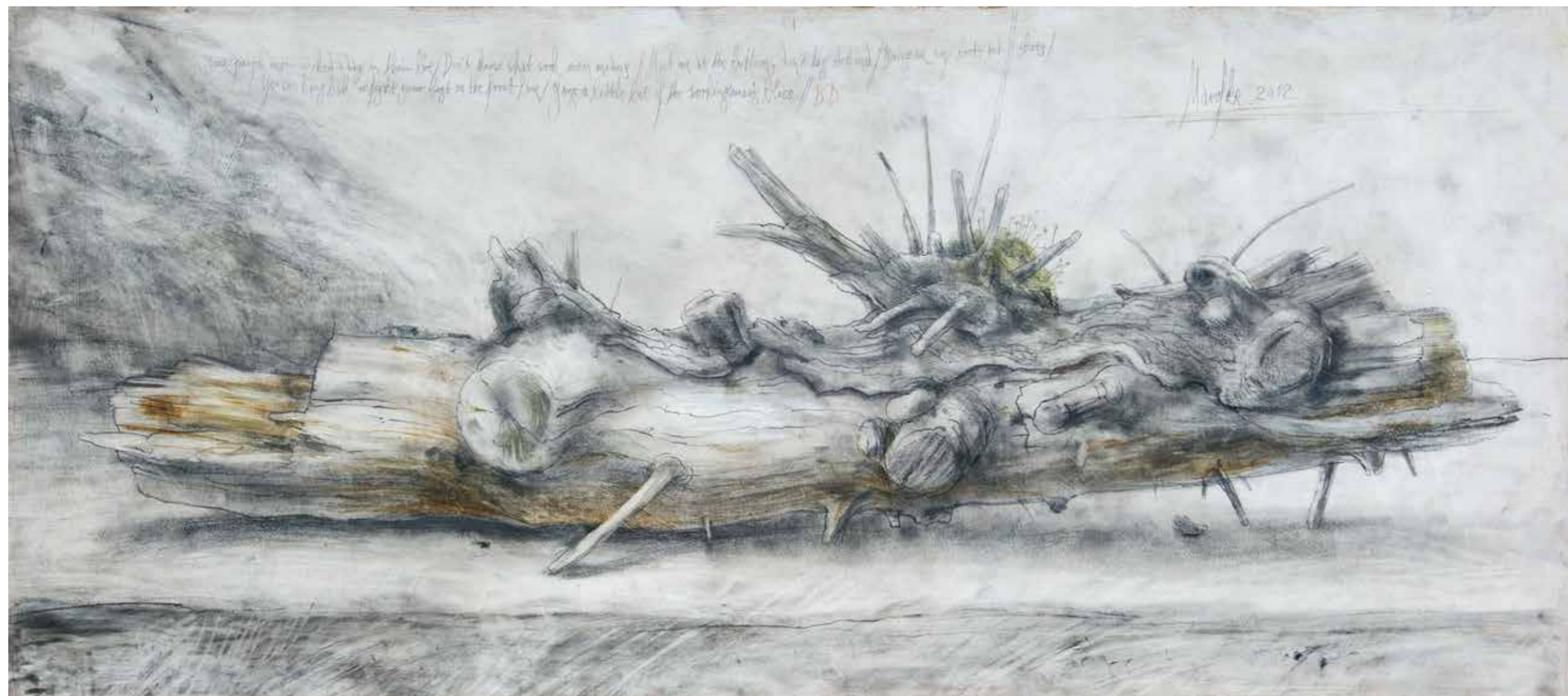
Workingman's Blues · 2012 · Grafit und Farbstift auf grundiertem Karton · 400 x 930 mm